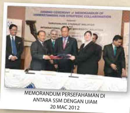
MEMORANDUM PERSEFAHAMAN DI ANTARA SSM DENGAN UIAM 20 MAC 2012