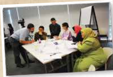
ENGLISH PROFICIENCY PROGRAMME