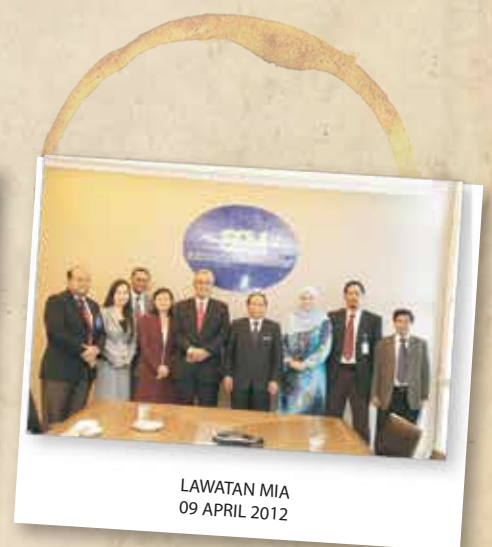
LAWATAN MIA 09 APRIL 2012