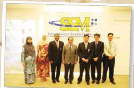
LAWATAN MICPA 20 NOVEMBER 2012