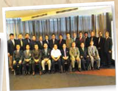
PERHEBAT 12 JULAI 2012