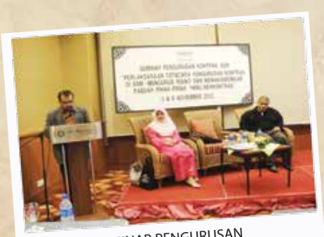
SEMINAR PENGURUSAN KONTRAK SSM 5 & 6 NOVEMBER 2012