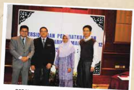
PERSIDANGAN PENGUATKUASAAN 2012 KALI KE-4 10-12 DISEMBER 2012