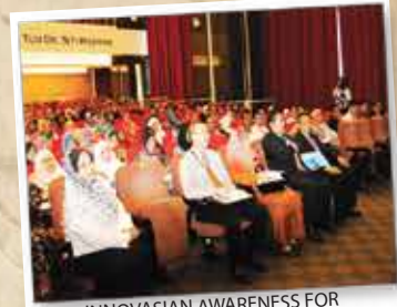
INNOVASIAN AWARENESS FOR SSM NON EXECUTIVE 24 MEI 2012