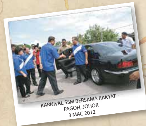
KARNIVAL SSM BERSAMA RAKYAT - PAGOH, JOHOR 3 MAC 2012