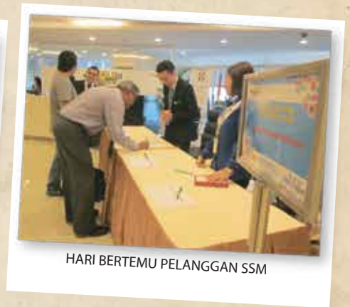
HARI BERTEMU PELANGGAN SSM