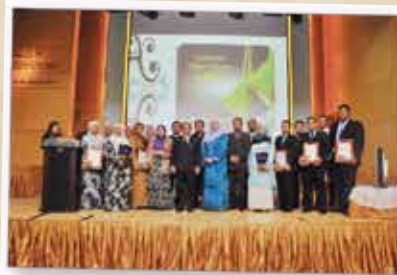
PERHIMPUNAN BULANAN SSM 18 OGOS 2012