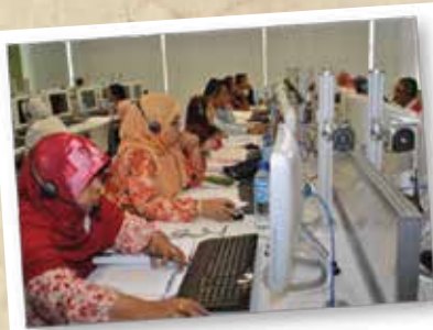
ICT PROFICIENCY PROGRAMME