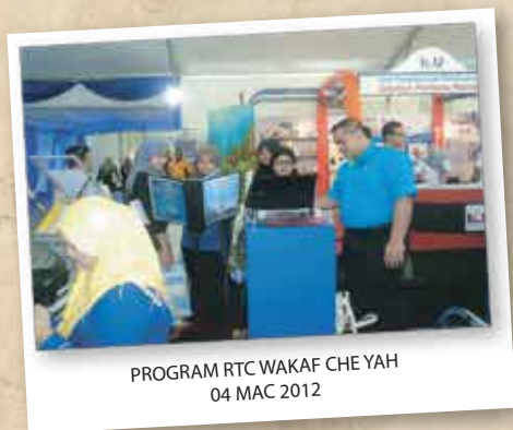
PROGRAM RTC WAKAF CHE YAH 04 MAC 2012