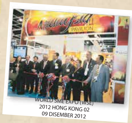
WORLD SME EXPO (WSE) 2012 HONG KONG 02 09 DISEMBER 2012