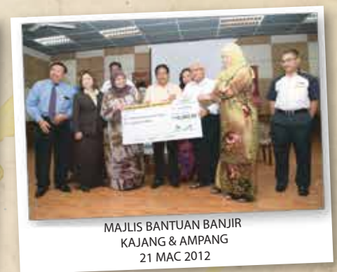
MAJLIS BANTUAN BANJIR KAJANG & AMPANG 21 MAC 2012