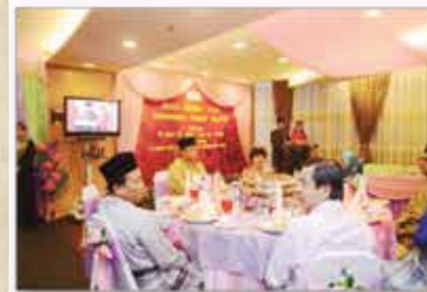
MAJLIS BERBUKA PUASA SSM 1 OGOS 2012 MENARA SSM@SENTRAL