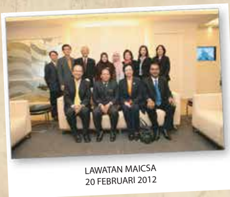
LAWATAN MAICSA 20 FEBRUARI 2012