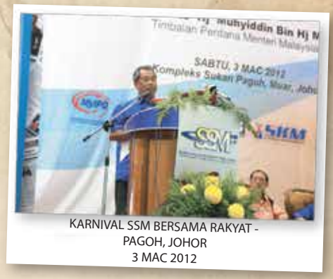
KARNIVAL SSM BERSAMA RAKYAT - PAGOH, JOHOR 3 MAC 2012