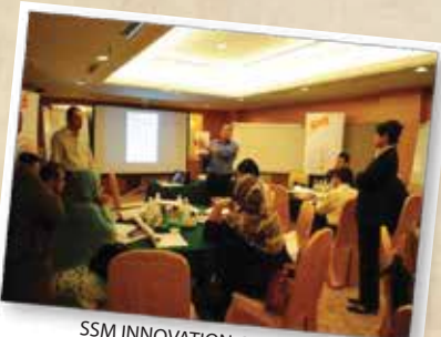
SSM INNOVATION CATALYST TEAM BOOTCAMO 27-29 JULAI 2012