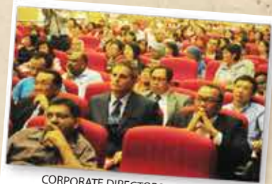
CORPORATE DIRECTORS TRAINING PROGRAMME (CDTP) PREMIER 11 DISEMBER 2012