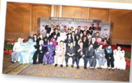
SSM NATIONAL CONFERENCE 2012 12 & 13 JUN 2012