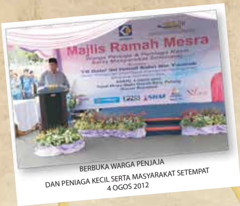
BERBUKA WARGA PENJAJA DAN PENIAGA KECIL SERTA MASYARAKAT SETEMPAT 4 OGOS 2012