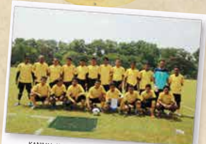
KANIVAL SUKAN KPDNKK BERSAMA AGENSI BAIK 16, 17 DAN JUN 2012 KOMPLEKS SUKAN UNITEN SERDANG