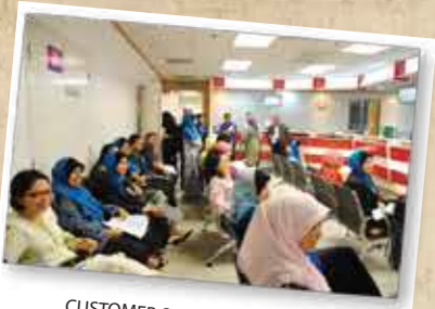
CUSTOMER SERVICE EXCELLENCE PROGRAMME