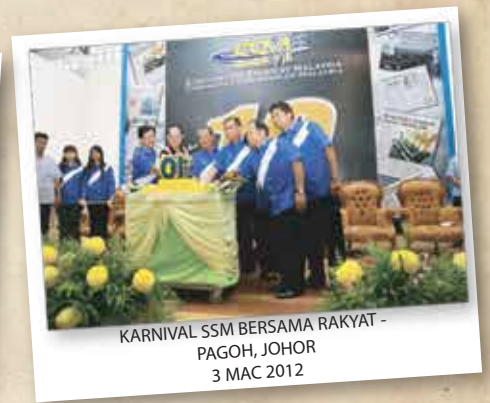
KARNIVAL SSM BERSAMA RAKYAT - PAGOH, JOHOR 3 MAC 2012