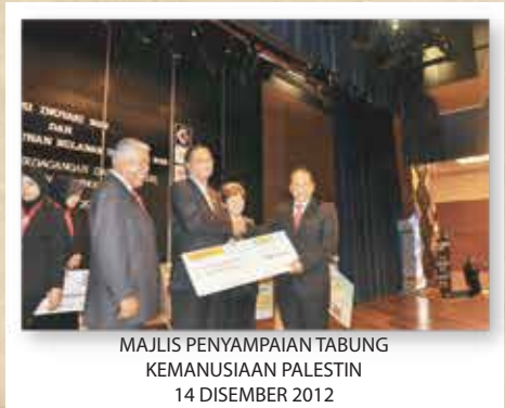
MAJLIS PENYAMPAIAN TABUNG KEMANUSIAAN PALESTIN 14 DISEMBER 2012