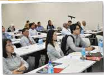
CORPORATE DIRECTORS TRAINING PROGRAMME (CDTP)