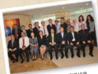
TRAINERS DEVELOPMENT HUB 12 JANUARI 2012