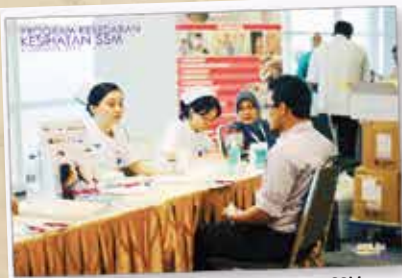
PROGRAM KESEDARAN KESIHATAN SSM, TINGKAT 14, MENARA SSM@SENTRAL 6 DISEMBER 2012