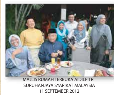
MAJLIS RUMAH TERBUKA AIDILFITRI SURUHANJAYA SYARIKAT MALAYSIA 11 SEPTEMBER 2012