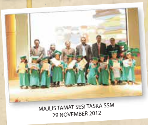
MAJLIS TAMAT SESI TASKA SSM 29 NOVEMBER 2012