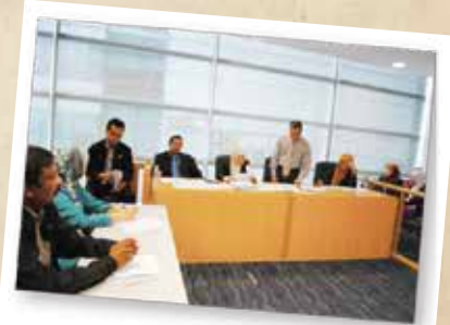
ENFORCEMENT RELATED TRAINING PROGRAMME