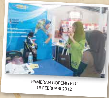
PAMERAN GOPENG RTC 18 FEBRUARI 2012