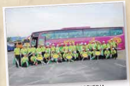
PERHIMPUNAN HARI PEKERJA PERINGKAT KEBANGSAAN 12 MEI 2012 MAEP, SERDANG