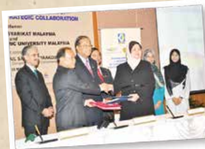
SSM & IIUM MOU SIGNING 20 MAC 2012