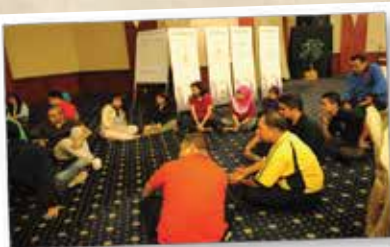
FUNDAMENTAL OF INNOVATION EXECUTIVE 18-23 JUN 2012