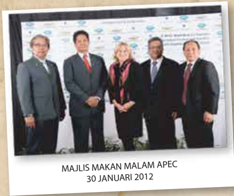
MAJLIS MAKAN MALAM APEC 30 JANUARI 2012