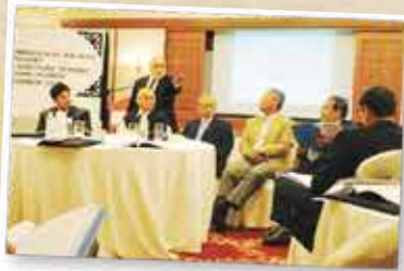
CORPORATE DIRECTORS TRAINING PROGRAMME (CDTP) PREMIER 11 DISEMBER 2012