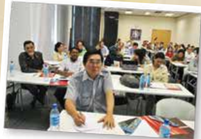
LICENSED SECRETARY TRAINING PROGRAMME (LSTP)