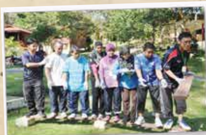
PERSONAL DEVELOPMENT PROGRAMME SRI DINA RETREAT, JANDA BAIK 13-15 SEPTEMBER/16-18 SEPTEMBER 2012