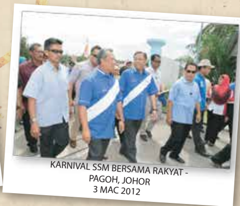
KARNIVAL SSM BERSAMA RAKYAT - PAGOH, JOHOR 3 MAC 2012