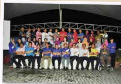
ALL-STAR TRAINING GOLD COAST, MORIB 13-15 DISEMBER 2012