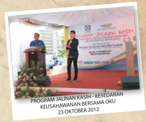
PROGRAM JALINAN KASIH - KESEDARAN KEUSAHAWANAN BERSAMA OKU 23 OKTOBER 2012