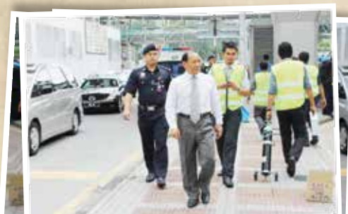
LATIHAN KEBAKARAN DAN PENGUNGSIAN BANGUNAN DI MENARA SSM@SENTRAL 13 DISEMBER 2012