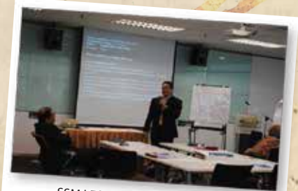
SSM LEADING AND MANAGING INNOVASIAN WORKSHOP 30 JULAI 2012