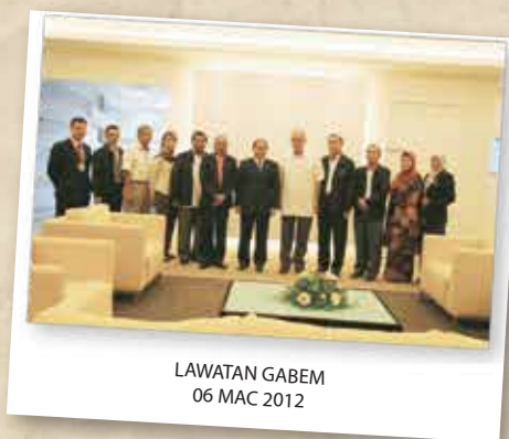
LAWATAN GABEM 06 MAC 2012